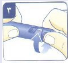
آماده سازی برای هواگیری:

انسولین برای تزریق زیر جلدی میباشد. هیچگاه انسولین را مستقیماً داخل ورید یا عضله تزریق نکنید. همیشه محل تزریق را تغییر دهید تا از ایجاد توده در محل تزریق جلوگیری نمایید.